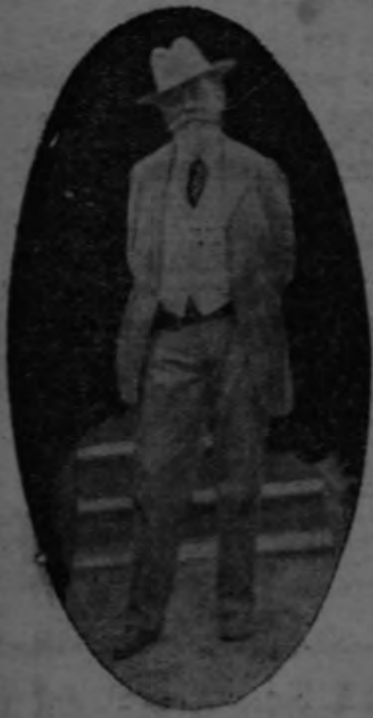
VENUSTIANO CARRANZA Jefe de la Revolución Mexicana

MEXICO, 28.—Asegúrase que Carranza, Gobernador del Estado